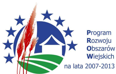
LOGO PROW 2007-2013